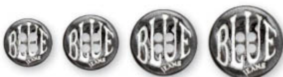
A B C D