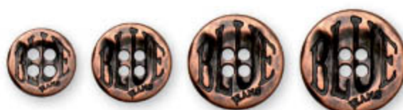
E F G H