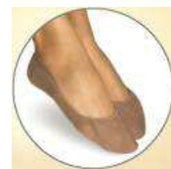
CC20 / CC22