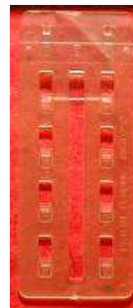
B825 et B826 Transparent