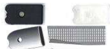
901701 / 901702