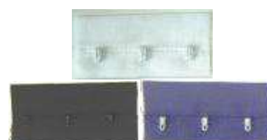
50006/511 agrafe corset sur bande