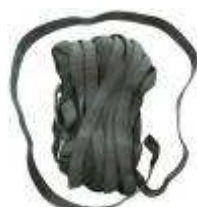
800110 protège baleine