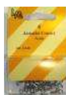
L1130 / L1131